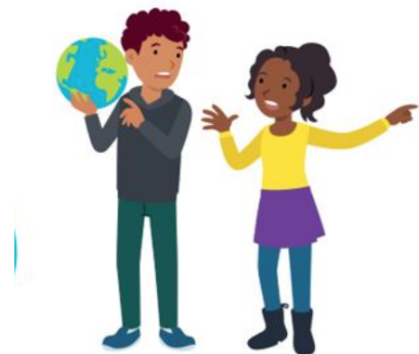
We lossen conflicten zelf op

Wij zijn inmiddels gestart met de lessen uit blok 2. Het doel van de lessen in dit blok is kinderen te leren om op een positieve manier met conflicten om te gaan. De lessen zijn onder andere gericht op het verschil tussen conflict en ruzie. Een conflict is een verschil van mening: je wilt bijvoorbeeld allebei iets anders doen of hebben. Bij een conflict wil je een oplossing bedenken waar je allebei tevreden mee bent. Je zoekt naar win-win oplossingen. Conflicten horen bij het leven. Wanneer conflicten met geweld gepaard gaan, spreken we van ruzie. We leren kinderen dat je op drie manieren kunt reageren op een conflict en benoemen hierbij dat je steeds een andere "pet" opzet. Ter ondersteuning zijn er daadwerkelijk petten in de klassen aanwezig. Of je loopt weg, je zegt niet wat je ervan vindt ( blauwe pet ). Of je reageert agressief, je bent boos en wordt driftig ( rode pet ). Of je staat stevig, je komt op voor jezelf en houdt ook rekening met de ander: je zoekt naar een win-win-oplossing ( gele pet ). In groep 1 en 2 leren de kinderen zelf hun conflicten op te lossen met behulp van de LOS HET OP-kaart. In groep 3 tot en met 8 leren de kinderen dat met behulp van het stappenplan PRAAT HET UIT. In de bovenbouw gaan de lessen over kritisch naar jezelf kijken, hoe je met je eigen mening en met kritiek omgaat. En wordt ook gekeken naar conflicten in de wereld en de rol van de Verenigde Naties.