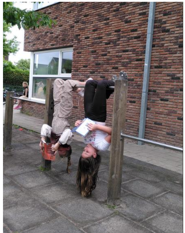
De boeken werden meteen gelezen in de pauze

Onze kast is inmiddels helemaal 'leeg gelezen', dus aanvulling is van harte welkom!